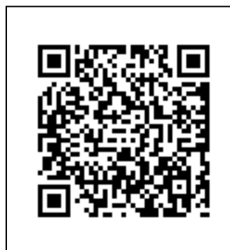
【開催案内SNS(Instagramとフェイスブック)のQRコード】